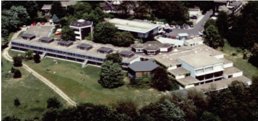
Akademie für musische Bildung Remscheid

DEUTSCHER HARMONIKA VERBAND e.V. SITZ TROSSINGEN